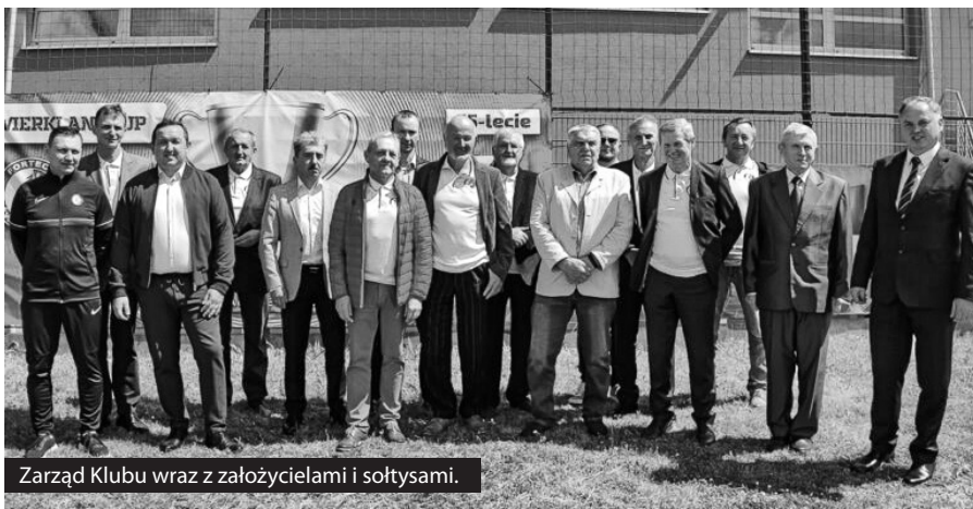
Zarząd Klubu wraz z założycielami i sołtysami.

Bez Was wszystkich, bez Waszego wsparcia i zaangażowania nie byłoby tak rozbudowanego, prężnego i tętniącego życiem klubu, jakim jest FORTECA Świerklany - klubu skupiającego młodzież i seniorów, spełniającego pokładane w nim nadzieje i oczekiwania, a zarazem klubu uczącego sportowej rywalizacji, w duchu dobrego wychowania i poszanowania innych.