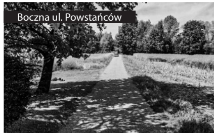
Boczna ul. Powstańców