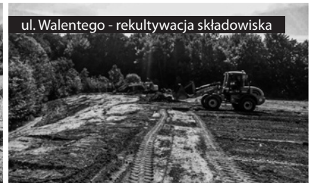
ul. Walentego - rekultywacja składowiska