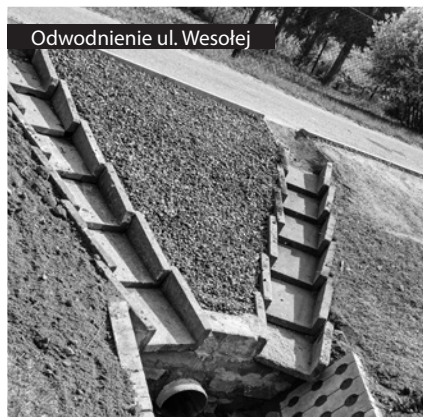
Odwodnienie ul. Wesołej