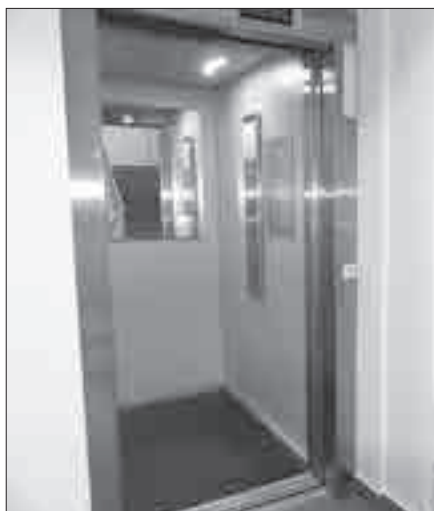
W budynku użyteczności publicznej przy ul. Kościelnej 85 w Świerklanach do dyspozycji petentów jest winda.

osoby niewidomej do konkretnego referatu lub biura (również z psem asystującym) – pomocą służą w tym zakresie pracownicy UG. Szczegółowy wykaz instytucji oraz informacje dotyczące numeracji pomieszczeń (np. gdzie znajdują się toalety dla niepełnosprawnych) zawarty został w Deklaracji.