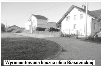
Wyremontowana boczna ulica Biasowickiej