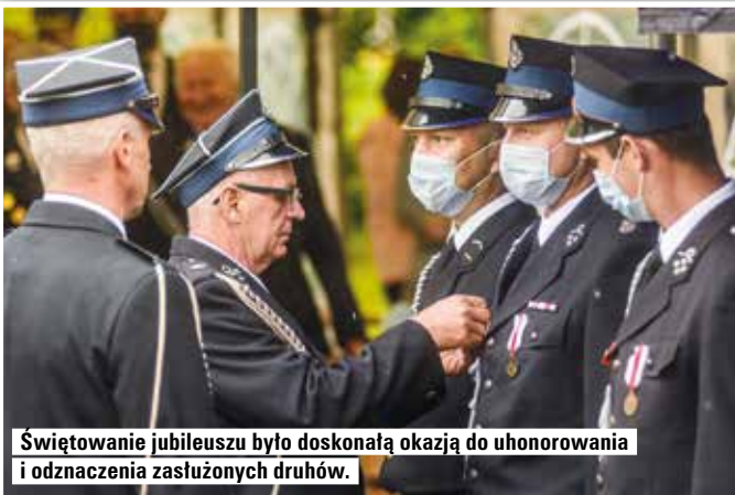
Świętowanie jubileuszu było doskonałą okazją do uhonorowania i odznaczenia zasłużonych druhów.