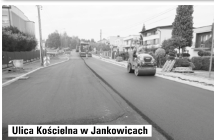
Ulica Kościelna w Jankowicach