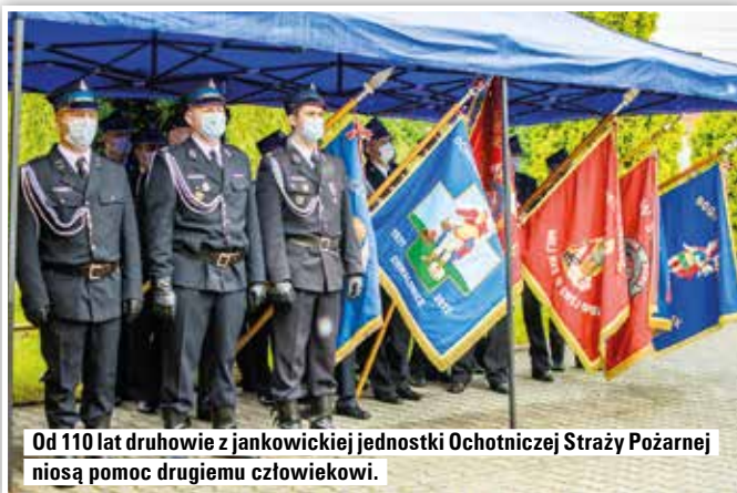
Od 110 lat druhowie z jankowickiej jednostki Ochotniczej Straży Pożarnej niosą pomoc drugiemu człowiekowi.