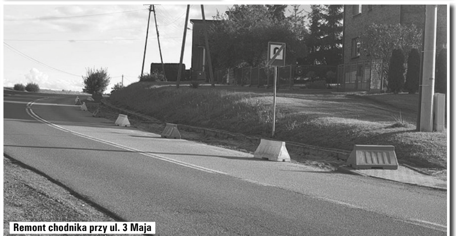
Remont chodnika przy ul. 3 Maja