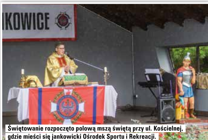
Świętowanie rozpoczęło polową mszą świętą przy ul. Kościelnej, gdzie mieści się jankowicki Ośrodek Sportu i Rekreacji.