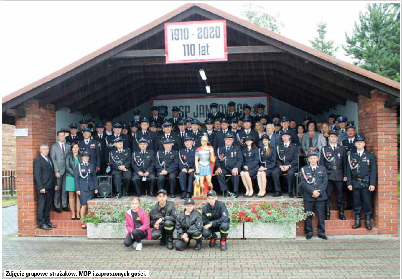
Zdjęcie grupowe strażaków, MDP i zaproszonych gości.