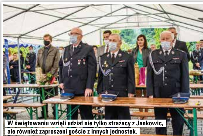
W świętowaniu wzięli udział nie tylko strażacy z Jankowic, ale również zaproszeni goście z innych jednostek.