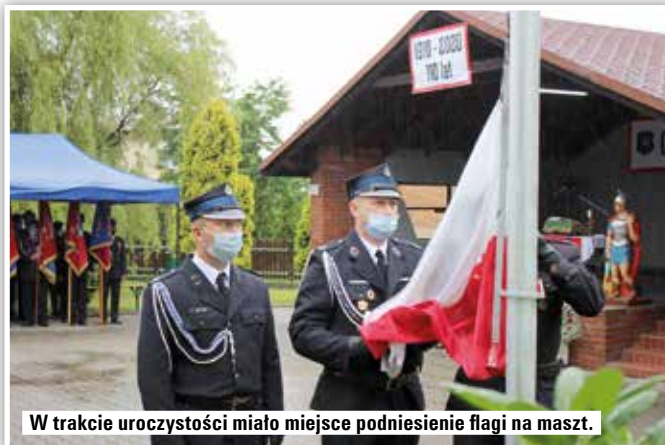
W trakcie uroczystości miało miejsce podniesienie flagi na maszt.