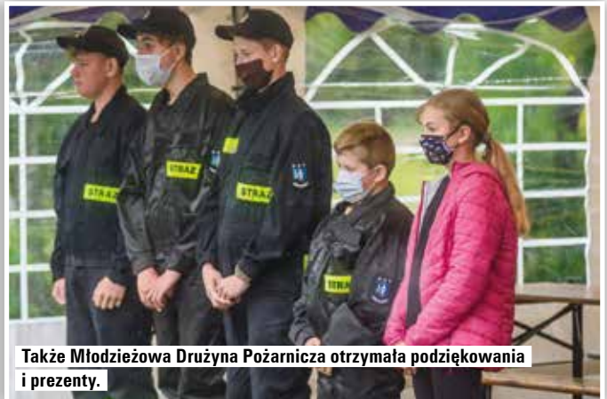
Także Młodzieżowa Drużyna Pożarnicza otrzymała podziękowania i prezenty.