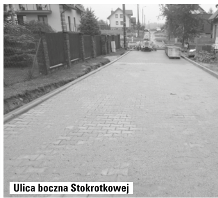
Ulica boczna Stokrotkowej