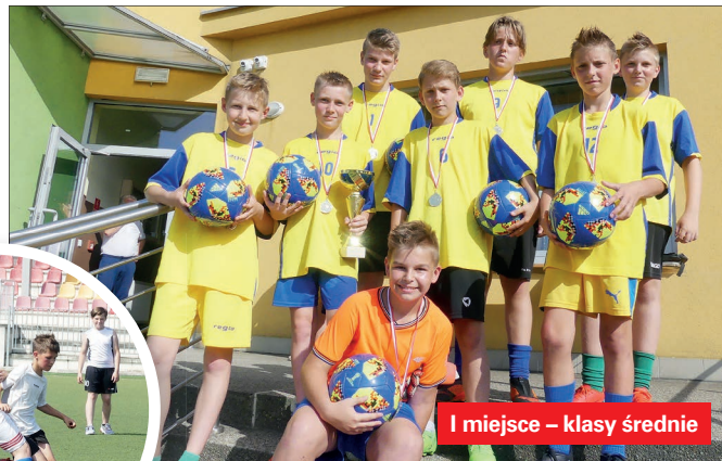
I miejsce – klasy średnie

Dwa tygodnie później – 12 czerwca, do walki o zwycięstwo stanęły drużyny z klas IV, V i VII SP. Tu najlepsi okazali się zawodnicy z FC Karzeł – I miejsce, którzy pokonali w ostatecznej klasyfikacji For-