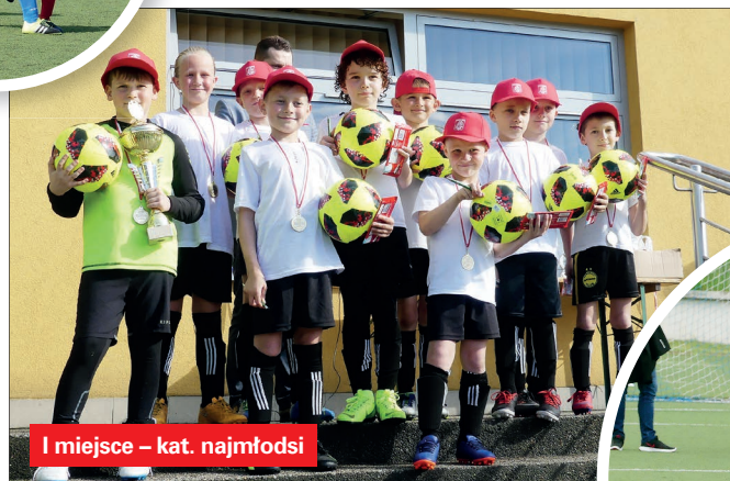
I miejsce – kat. najmłodszi