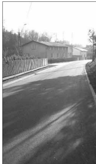
Jedną z ostatnich inwestycji był remont ul. Wiejskiej w Świerklanach

Inwestycje w placówki oświatowe, to oczywiście nie wszystko. Wystarczy wspomnieć, o remontach dróg (szczegółowo piszemy o tym na str. 3), z których ostatni zakończył się kilka dni temu i dotyczył ul. Wiejskiej. Tematowi temu towarzyszy poprawa estetyki w gminie, polegająca m.in. na zamontowaniu na drogach wjazdowych do gminy tzw. witaczy. Na dzień dzisiejszy zamontowano ich 7 sztuk, na ulicach: