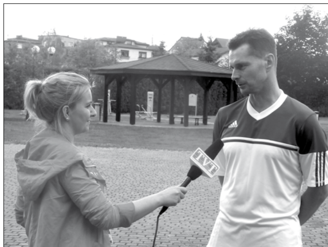
Ekipa Telewizji TVT towarzyszy nam podczas ważnych uroczystości i ciekawych wydarzeń. Na zdjęciu – relacja z marszu nordic walking, maj 2016 r.