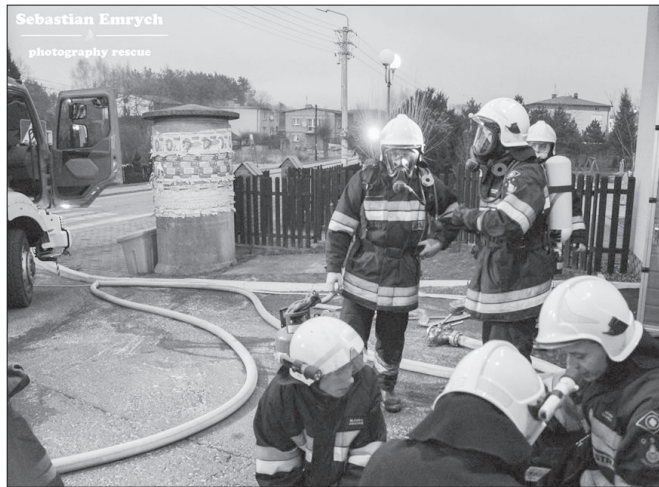
Strażacy stale rozwijają swoje umiejętności podczas różnego rodzaju ćwiczeń. Ostatnie odbyły się w OSP Jankowice i były połączeniem zagadnień z zakresu pożarnictwa i ratownictwa medycznego.