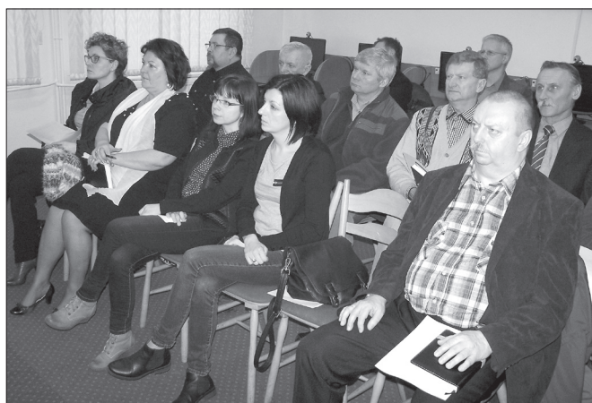
W spotkaniu z policjantami wzięli udział mieszkańcy, przedstawiciele organizacji i gminnych instytucji