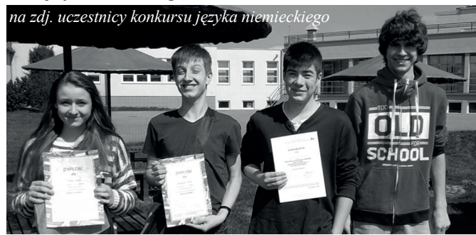
na zdj. uczestnicy konkursu języka niemieckiego