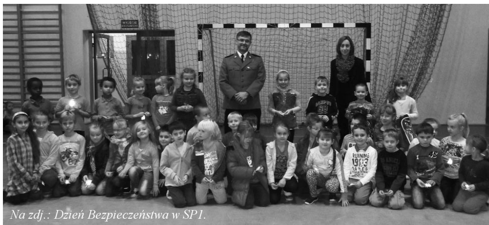
Na zdj.: Dzień Bezpieczeństwa w SP1.