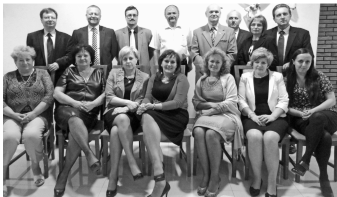
Pamiątkowe zdjęcie uczestników spotkania.