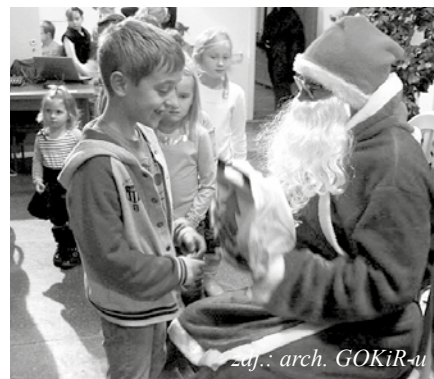
zaj.: arch. GOKiR-u

Za pomoc w organizacji mikołajko- wej imprezy artystycznej GOKiR pra- gnie serdecznie podziękować sponsorom: F.H. „Kotula”, Sklep „ABC”- Witolda