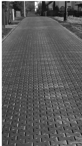
Na zdj.: Ulica K. Wielkiego przed i po remoncie.