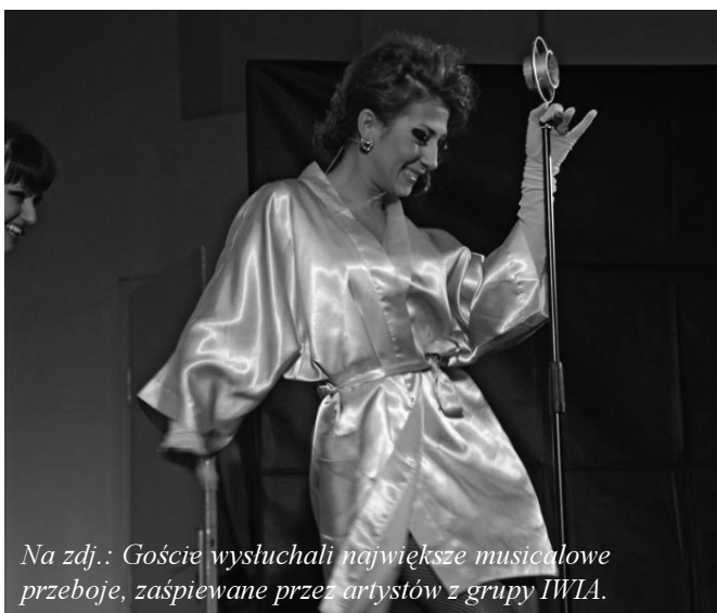
Na zdj.: Goście wysłuchali największe musicalowe przeboje, zaśpiewane przez artystów z grupy IWIA.