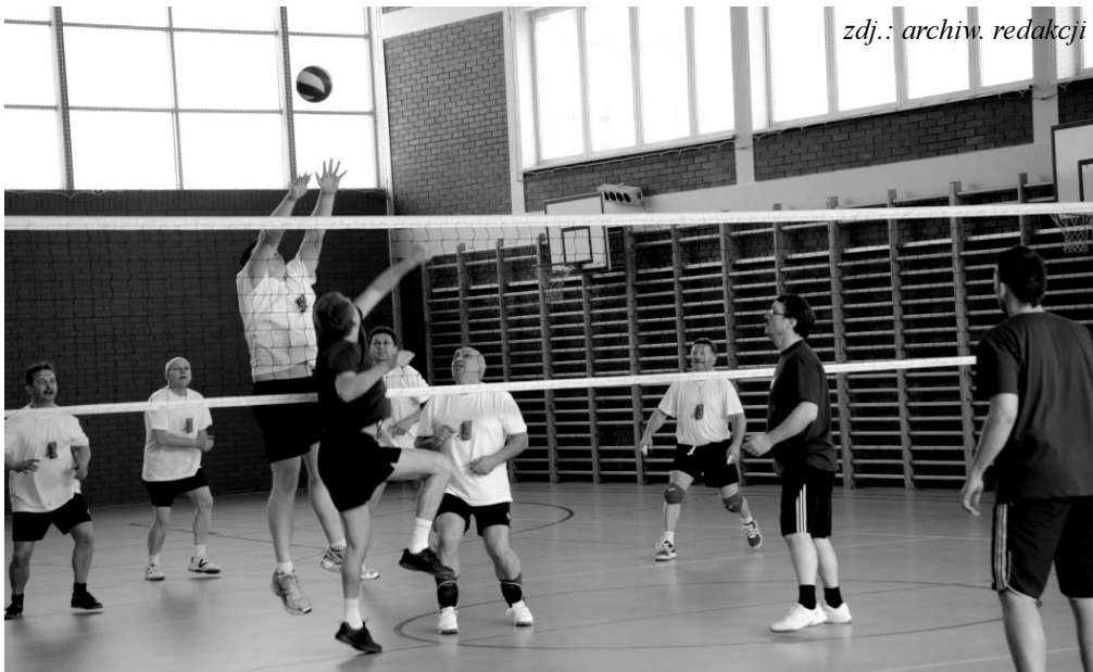
zdz.: archiw. redakcji