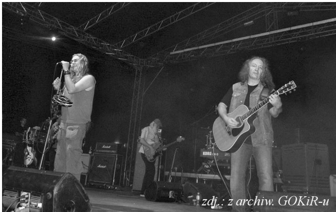
zdj.: z archiw. GOKiR-u

Organizatorem imprezy był Gminny Ośrodek Kultury i Rekreacji. tg