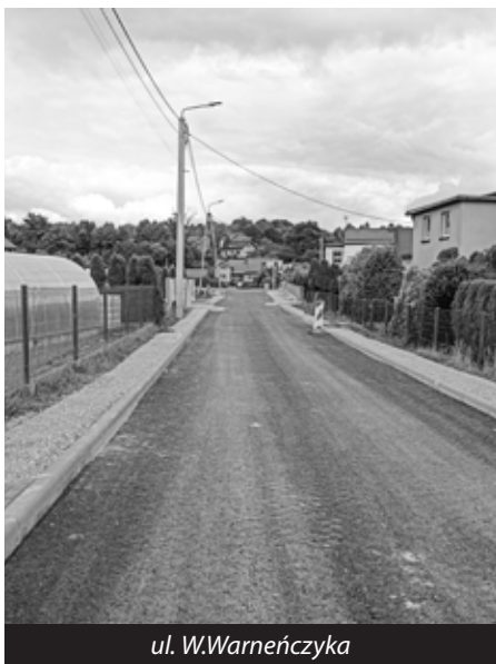
ul. W. Warneńczyka

Rok 2025 to okres intensywnych prac na naszych drogach. Aktualnie trwają prace drogowe związane z przebudową ul. W. Warneńczyka w Świerklanach. Jest to I etap prac, który obejmować będzie przebudowę tej ulicy łącznie z wykonaniem przepustu na rzece Szotkówka oraz kanalizacji deszczowej. Zaplanowane prace obejmują odcinek