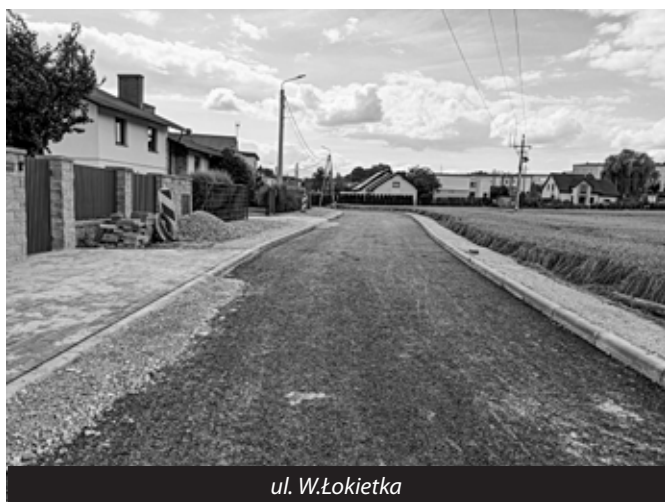
ul. W. Łokietka

280 metrów, a ich efektem będzie poprawa bezpieczeństwa mieszkańców oraz przepustowości na rzece Szotkówka.