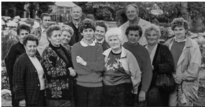
KGW Świerklany Górne rok 1991