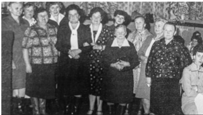
Gospodynie z KGW Świerklany Górne, uroczystość 35-lecia koła (1983 r.)