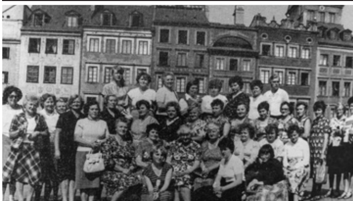
KGW Świerklany Górne, wycieczka do Warszawy, 1984 r.