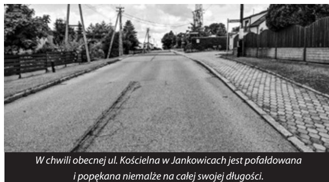
W chwili obecnej ul. Kościelna w Jankowicach jest pofalowana i popękana niemalże na całej swojej długości.

w gminie wyremontowaną przy udziale zewnętrznego wsparcia. Dofinansowanie z Rządowego Funduszu Rozwoju Dróg nie jest przy tym jedyną pomocą, jaką otrzymamy przy realizacji tego zadania – gmina zawarła również ugodę z Polską Grupą Górniczą S.A. Oddział KWK ROW Ruch Jankowice. W ramach szkód górniczych, na które jest narażona ulica Kościelna, PGG pokryje kolejną część kosztów remontu wyżej wymienionej drogi.