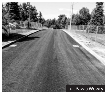
ul. Pawła Wowry

Natomiast w sierpniu br., dzięki zawartej jeszcze w ubiegłym roku ugodzie pomiędzy Gminą Świerklany a Polską Grupą Górniczą S.A. – Ruch Chwałowice, udało się poprawić stan najbardziej zniszczonego i zdeformowanego fragmentu ul. Pawła Wowry. Droga ta poddana jest wpływom działalności kopalni i wymaga systematycznej naprawy.